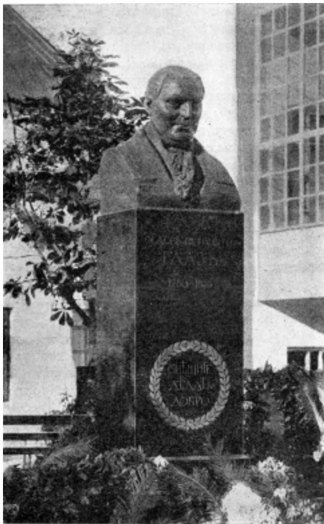
Памятник Ф. П. Гаазу в Москве с надписью: «Спешите делать добро».

Известно, что сестры Никольской общины вместе с вдовами петербургского и московского Вдовьих домов прибыли в Крым за 8 месяцев до отъезда туда первого отряда Крестовоз-