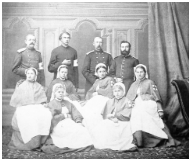
Сестры милосердия русского госпиталя в Бухаресте во время Русско-турецкой войны 1878—1879 гг. (Юськин А. Русский госпиталь в Бухаресте //Наше наследие. — 1991. — № 1. — С. 41)

повышается. Едва обученные, эти псевдомедики уже сознавали свое достоинство, исправно выпивая водку, предназначенную для больных, и вмешиваясь в предписания врача, перекраивая их на свой лад. Так, одному тяжелобольному брюшным тифом гвардейцу доктор прописал только жидкую пищу в очень малом количестве, однако свежеиспеченный фельдшер решил, что раненому наоборот следует укреплять желудок, поэтому стал кормить его сваренным вкрутую яйцом. Когда сестра милосердия, ухаживавшая за этим пациентом, заметила происходящее, было уже поздно, потому что фельдшер половину яйца уже скормил. Вскоре больной скончался 314 .