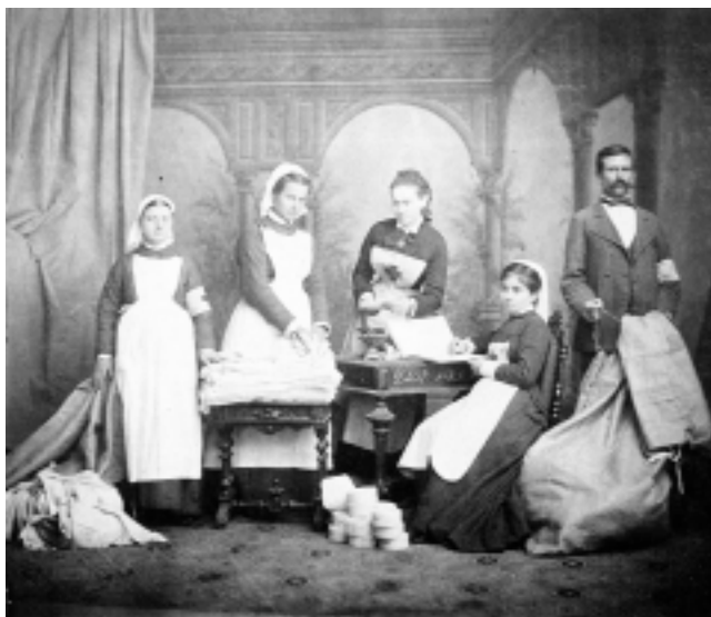
Младший медицинский персонал русского госпиталя в Бухаресте во время Русско-турецкой войны 1878—1879 гг. (Юськин А. Русский госпиталь в Бухаресте //Наше наследие. — 1991. — № 1. — С. 41)

следующий день утром — вес его неожиданно уменьшился на 8 кг. Повар эту необычайность объяснял способностью мяса за ночь “усыхать” 311 . В военном госпитале в Тырново сестра милосердия вместе с дежурным офицером взвесила полагавшуюся раненым норму вареной говядины, и оказалось, что вместо положенных 40 золотников в ней содержится лишь 16 312 . В такого рода условиях ничего необычайного не представляли камушки в вареном рисе, подозрительного вида чай, резиновые котлеты и овсяная каша, напоминавшая, по свидетельству самих раненых, помои, где “крупинка за крупинкой бегаёт с дубинкой” 313 .