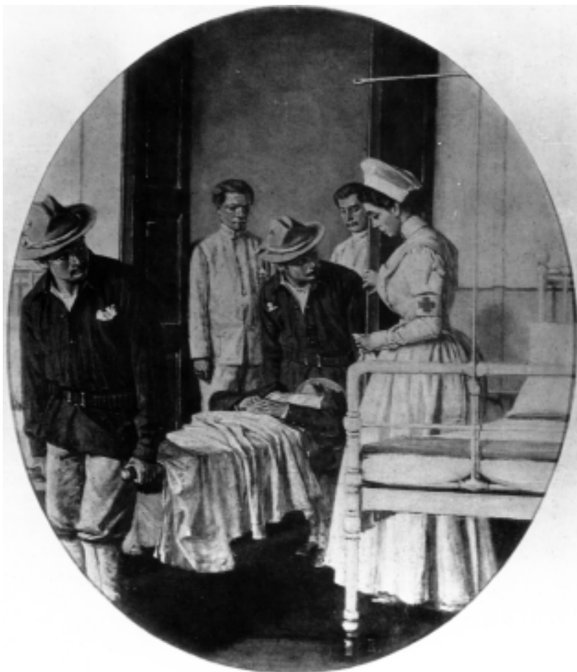
В. В. Верещагин. В госпитале. 1901 г. (Николаевский художественный музей им. В. В. Верещагина. № 50)

тересным, однако не выдержал, устал и заснул. Книга оказалась грамматикой латинского языка — бедный больной не решился сказать любимой сиделке, что подобного рода произведения его совсем не интересуют, и принуждал себя слушать 327 .