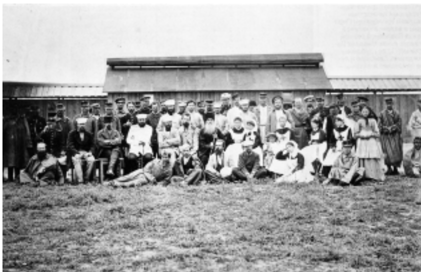
Медицинский персонал походного лазарета времен Русско-турецкой войны 1878–1879 гг. (Юськин А. Русский госпиталь в Бухаресте // Наше наследие. — 1991. — № 1. — С. 42)

Управление с требованием о выдаче денег, ссылаясь на то, что “передал лишнее, что у него недочет”. И подписывали, сознавая неправду, разыгрывая “комедию взаимного одолжения” 285 .