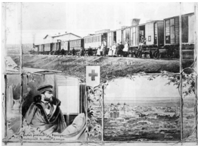
Санитарный поезд времен Русско-турецкой войны 1878—1879 гг., действовавший на территории Румынии. Коллаж (Юськин А. Русский госпиталь в Бухаресте //Наше наследие. — 1991. — № 1. — С. 39)

Часто сестрам в качестве прачек приходилось мыть и стирать больным белье. Иногда, в моменты затишья, приходилось писать для раненых письма домой — в целом рабочий день растягивался от 6–7 часов утра до 8–10 вечера 296 .