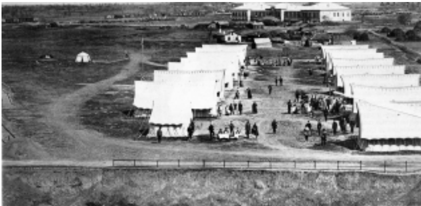
Походный лазарет времен Русско-турецкой войны 1878–1879 гг.; (Юськин А. Русский госпиталь в Бухаресте //Наше наследие. — 1991. — № 1. — С. 42)

ных лазаретов близ мест сражений, приютов для выздоравливающих, этапов по эвакуационному пути, “летучих” перевязывающих отрядов для подбирания раненых после сражения — все формировалось по классической схеме русского “авось”, т. е. спонтанно и с потерей драгоценного времени.